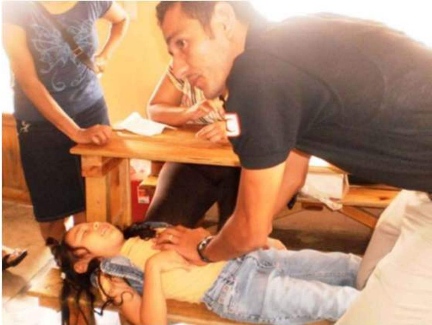
Personal de la Cruz Roja Hondureña impartieron un curso de primeros auxilios para las madres de los niños pacientes de CRIPCO