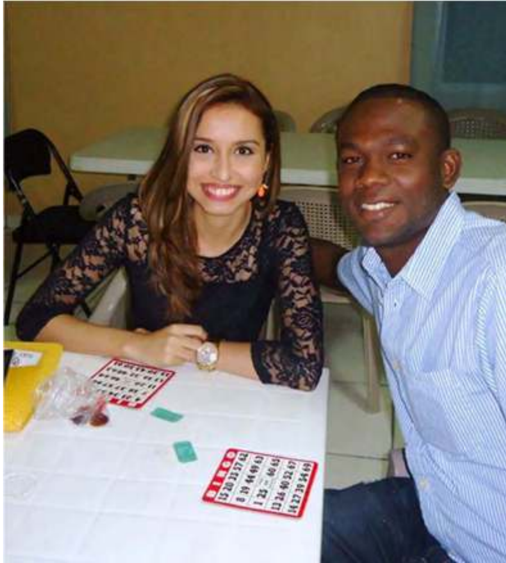
El viernes 27 de junio de 2014 se realizó un bingo a beneficio de CRIPCO. La Juventud CRIPCO participó.