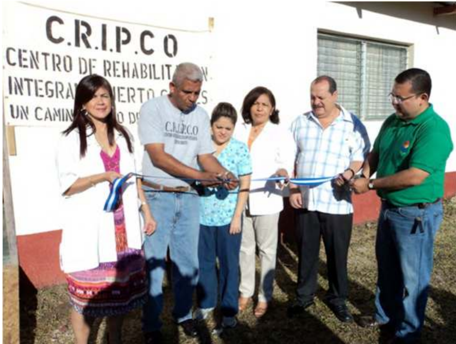
El lunes 1 de noviembre de 2010 , inauguración oficial de CRIPCO en el local prestado por el SITRAENP