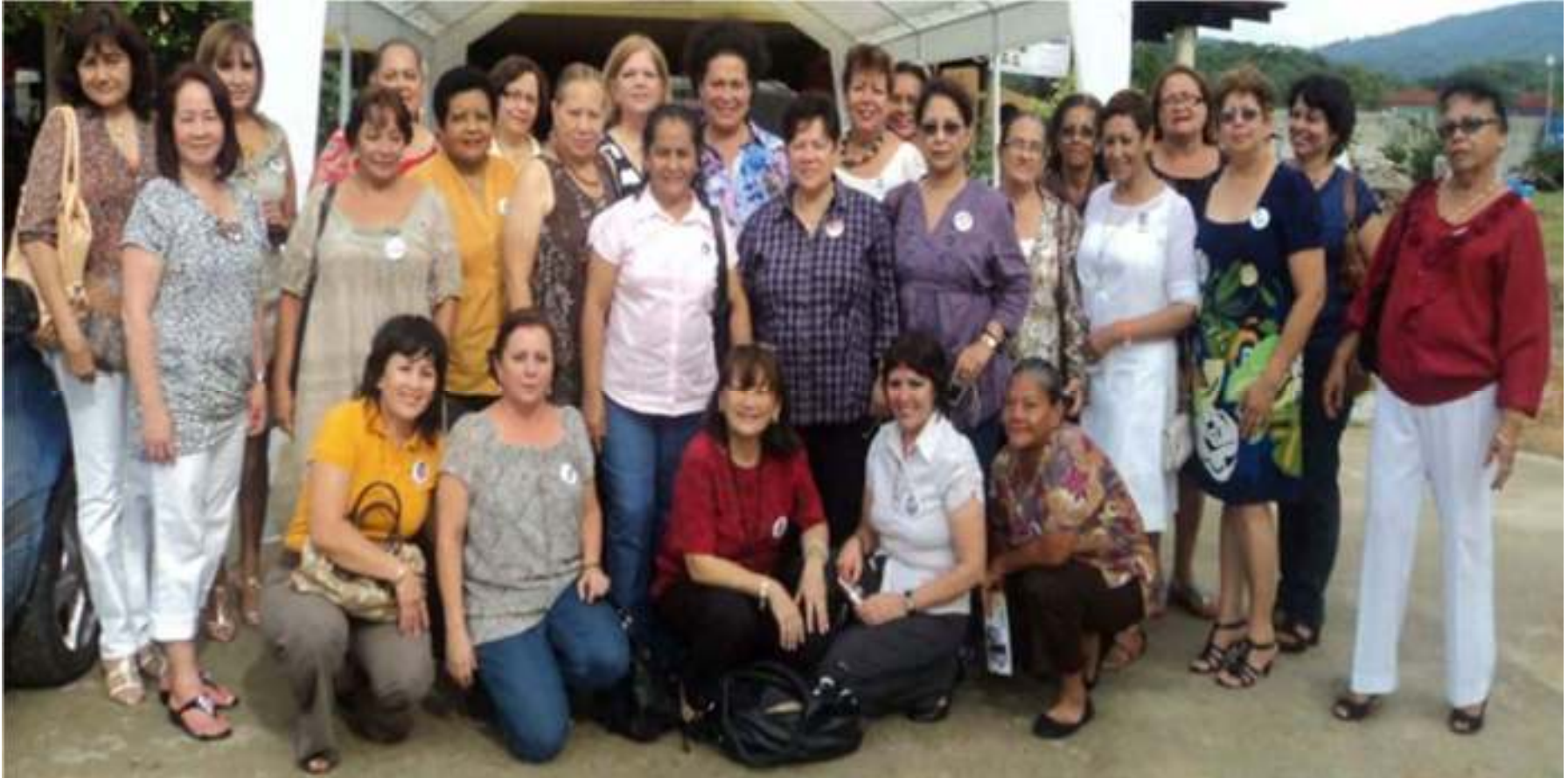
Un grupo de ex-compañeras de clases de las promociones 1972-1973 de los Institutos Sagrado Corazón de Jesús y Franklin Delano Roosevelt realizaron un " re-encuentro " en Puerto Cortés y aprovecharon para recolectar fondos y hacer un donativo a CRIPCO.